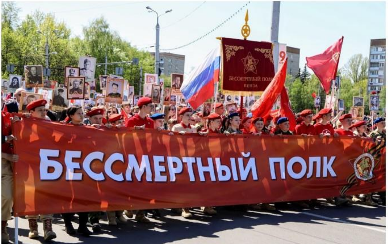
БЕССМЕРТНЫЙ ПОЛК - НАША ЖИВАЯ ПАМЯТЬ