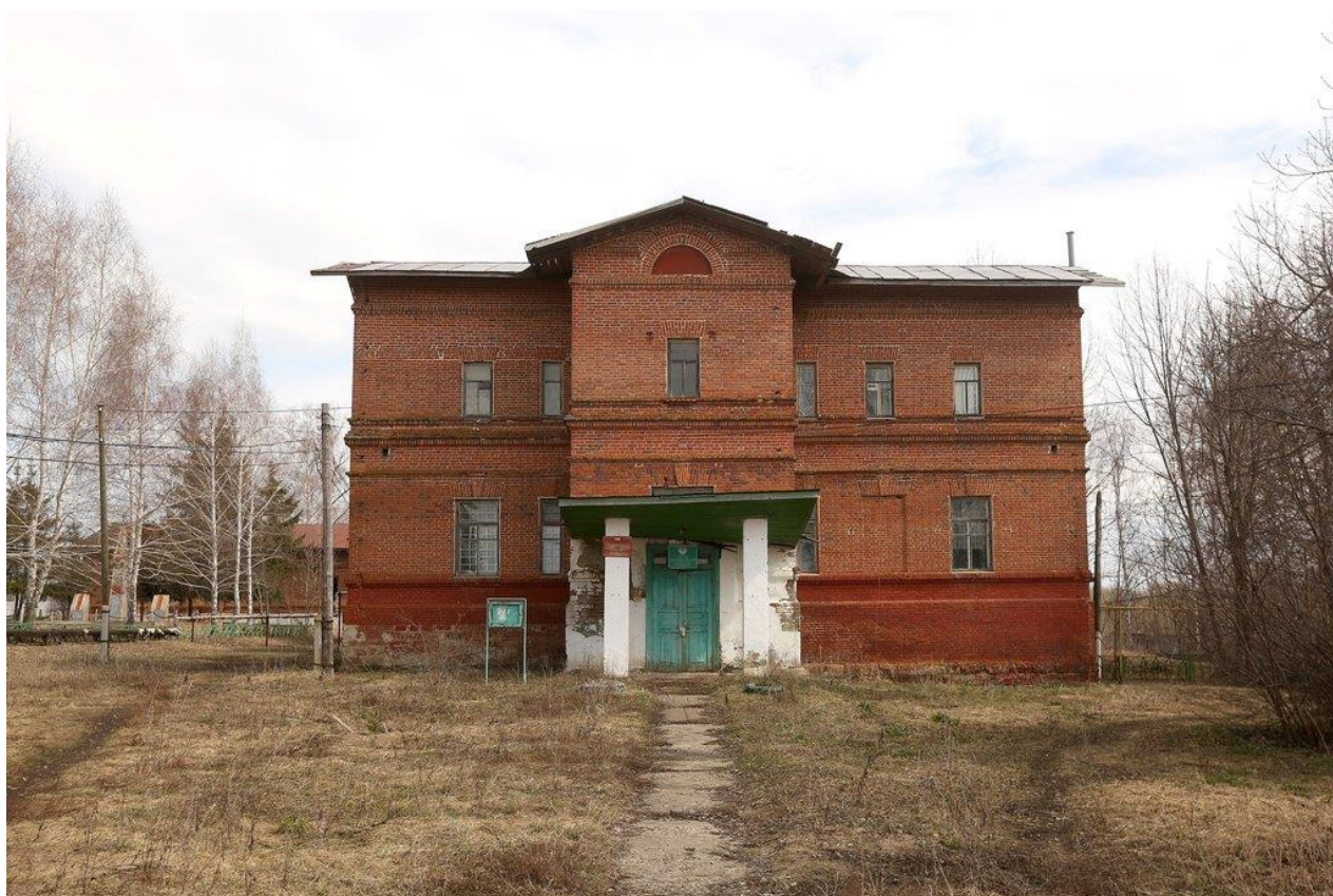
Приложение 2. Усадьба Ладыжеских в селе Завиваловка