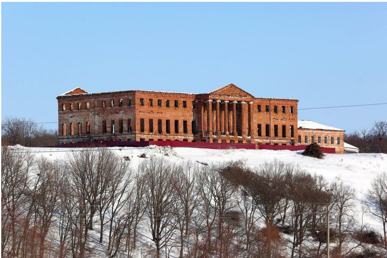
Приложение 3. Усадьба Надеждино князя Куракина