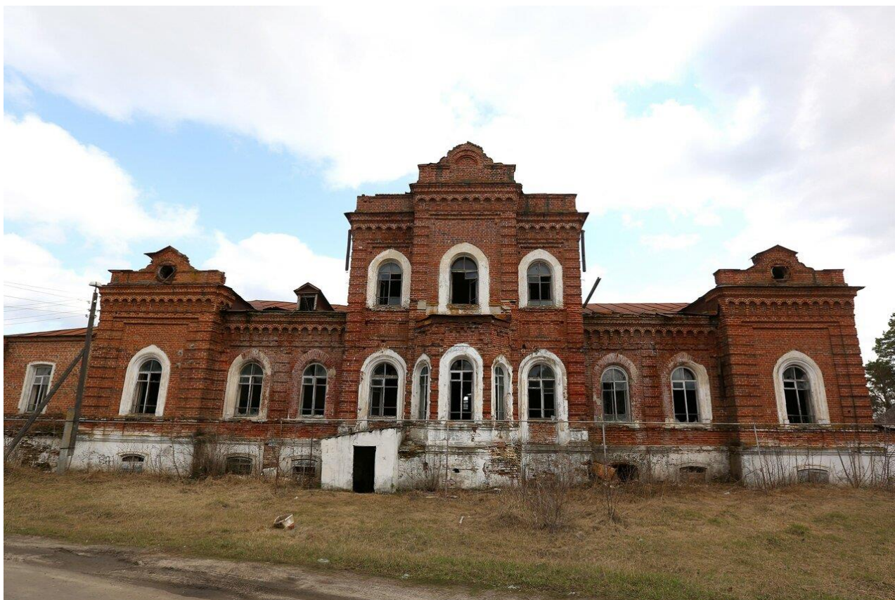
Приложение 5. Дом купца Макарова в Беково