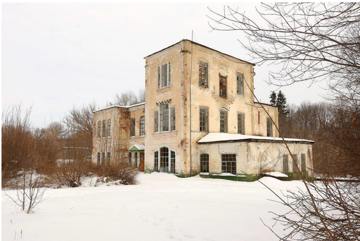
Приложение 1. Усадьба Араповых в Проказне