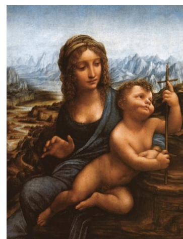
рис.9. Леонардо да Винчи Мадонна с пряхкой