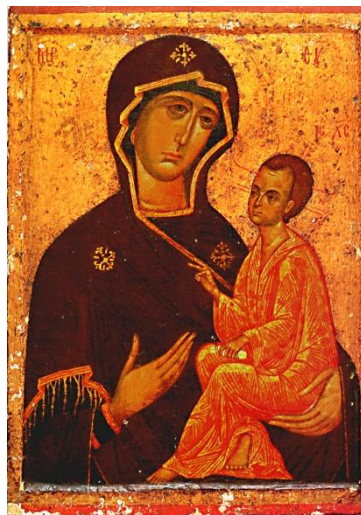
рис.2. Тихвинская икона Божией Матери