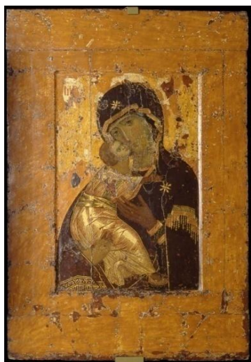
рис.1. Владимирская икона Божией Матери