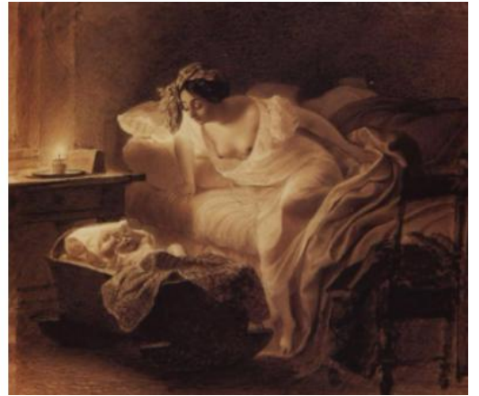
рис.10. Итальянские работы Карла Брюллова. Героини его картин – молодые итальянские матери.