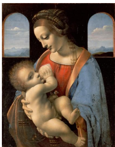
рис.7. Леонардо да Винчи Мадонна Литта