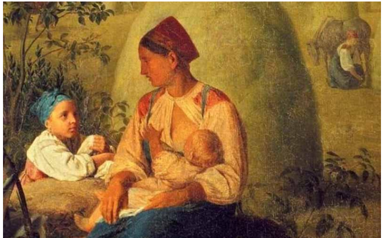
рис.11. Матери-крестьянки в работах Алексея Венецианова