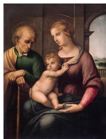
рис.6. «Мадонна с безбородым Иосифом», Санти, Рафаэль