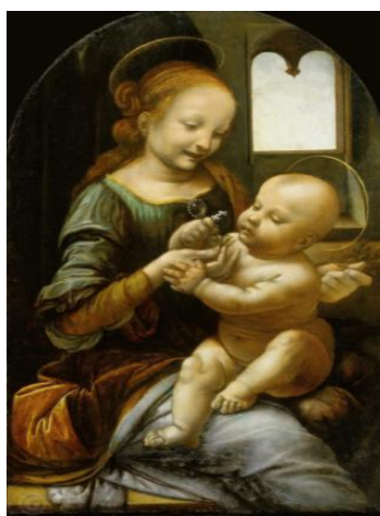
рис. 8. Леонардо да Винчи Мадонна Бенуа