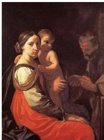
рис.5. «Мадонна с младенцем» Кантарини, Симоно