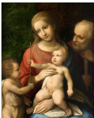
рис.4. «Мадонна с младенцем» Корреджо, Антонио Аллегри