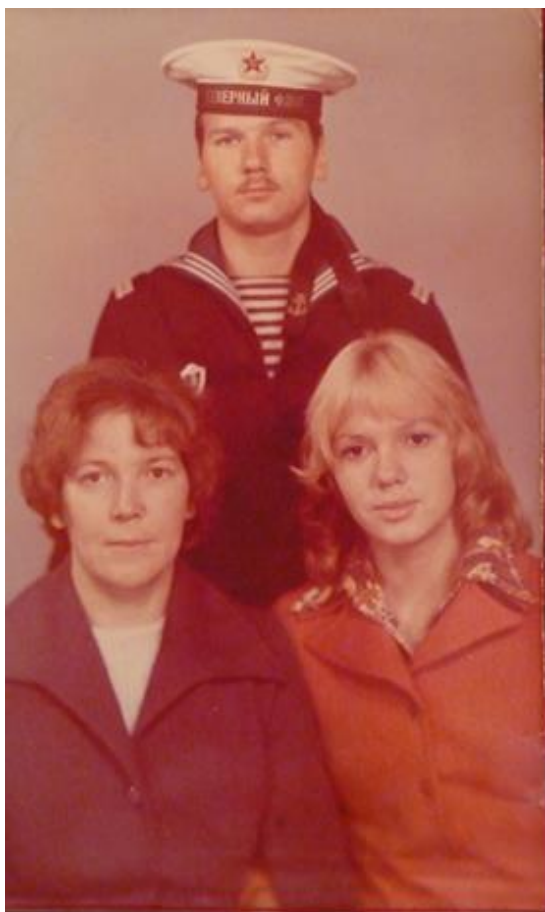
Совместная фотография с детьми