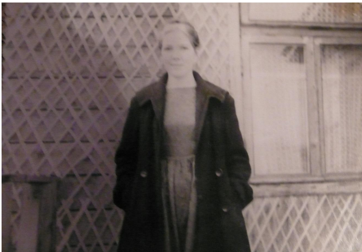
Фотография юных лет