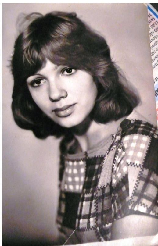
Фотографии дочери Татьяны Николаевны