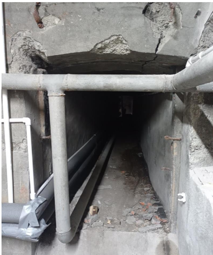
Система отопления, использовавшаяся ранее