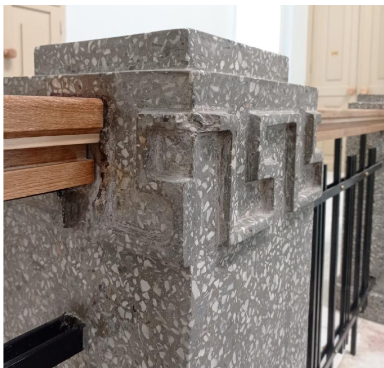
Сохранившийся фрагмент перил у лестницы