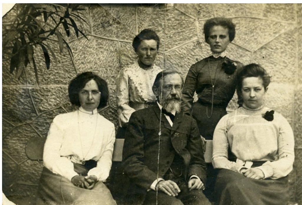
Московские Высшие женские курсы