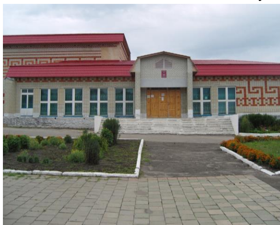
Библиотечно- досуговый центр села Пёстровка