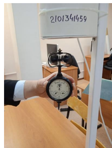
Измерение скорости потоков воздуха для Solar 60 и МСК 908