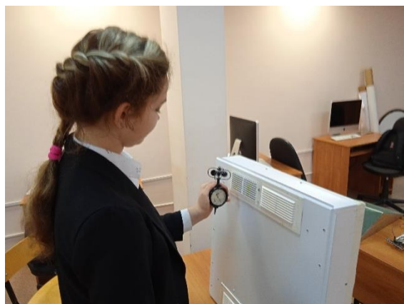
Измерение скорости потоков воздуха для SBAC