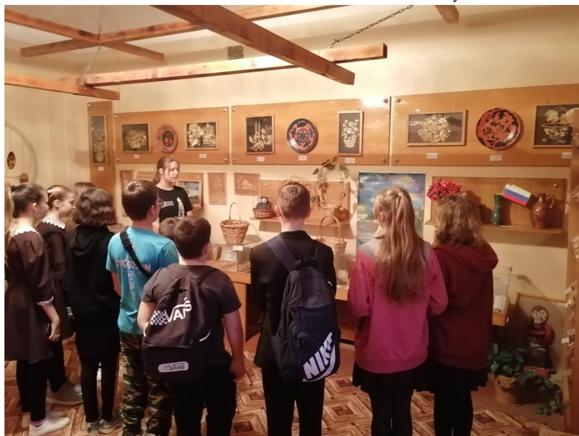
Фото 2. Экскурсия «Волшебная лоза» в школьном музее