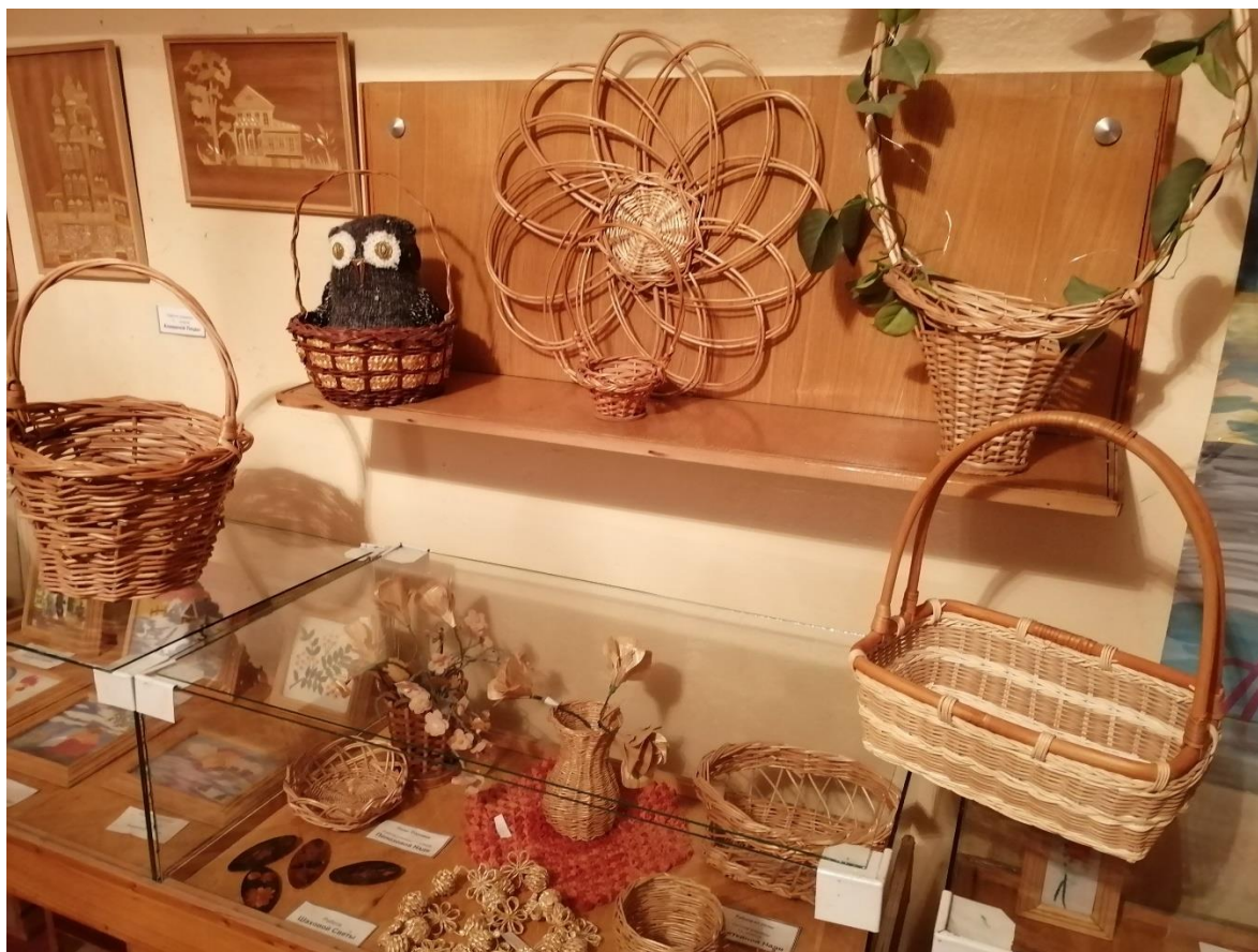
Фото 1. Выставка «Волшебная лоза» в школьном музее