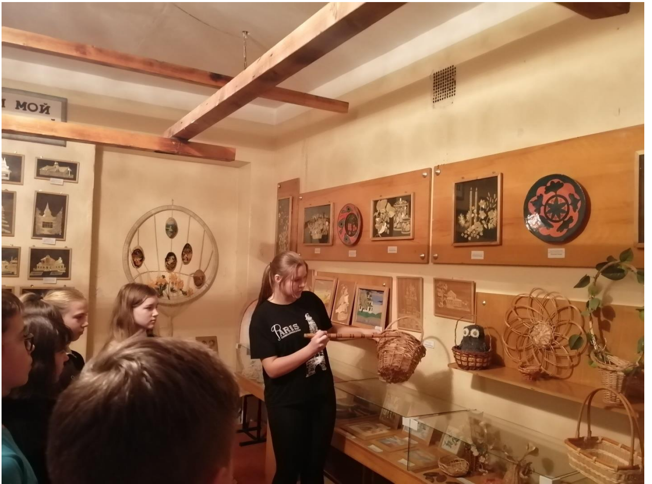
Фото 3. Экскурсия «Волшебная лоза» в школьном музее