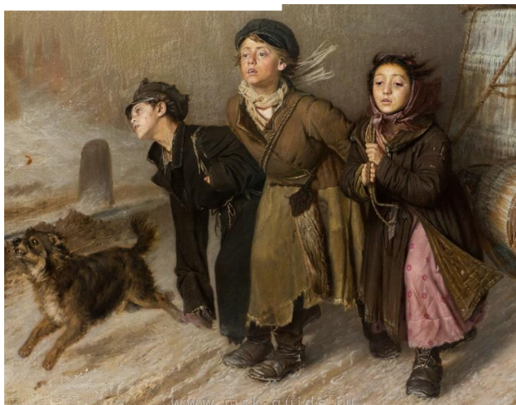
В.Перов «Тройка» (1866г.)