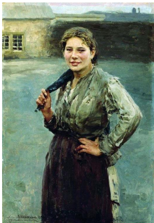
Н.Касаткин «Шахтёрка», 1894