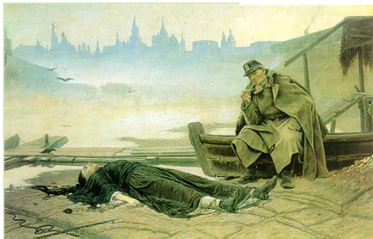
В.Перов «Утопленница» (1867г.)