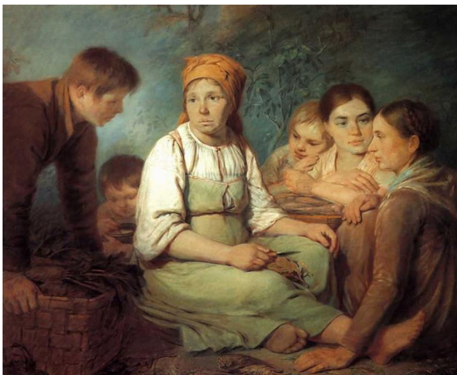
А.Венецианов «Очищение свёклы» (1820г.)