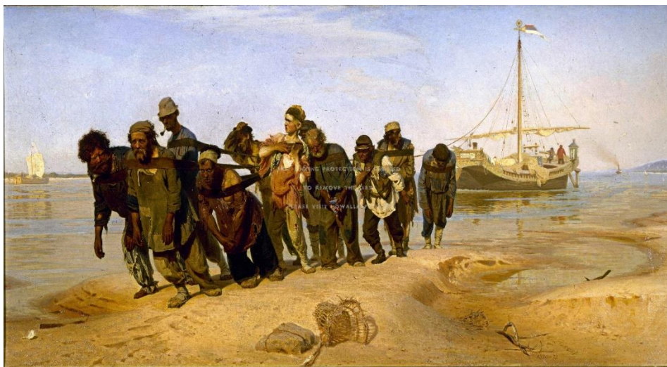
И.Репин «Бурлаки на Волге (1873г.)