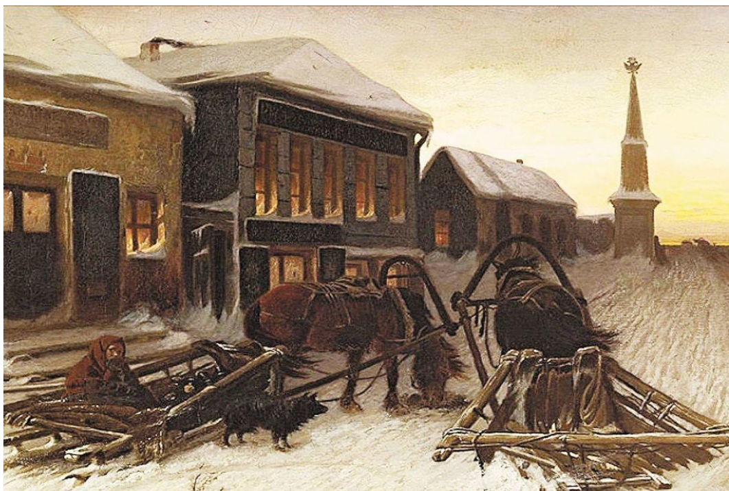
В.Перов «Последний кабак» (1868г.)