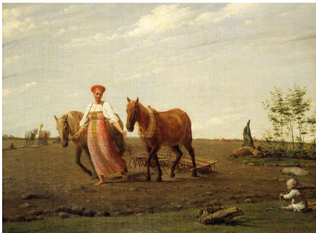
А.Венецианов «На пашне. Весна» (1820г.)