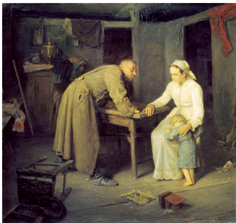
Н.Касаткин «Кто?», 1897