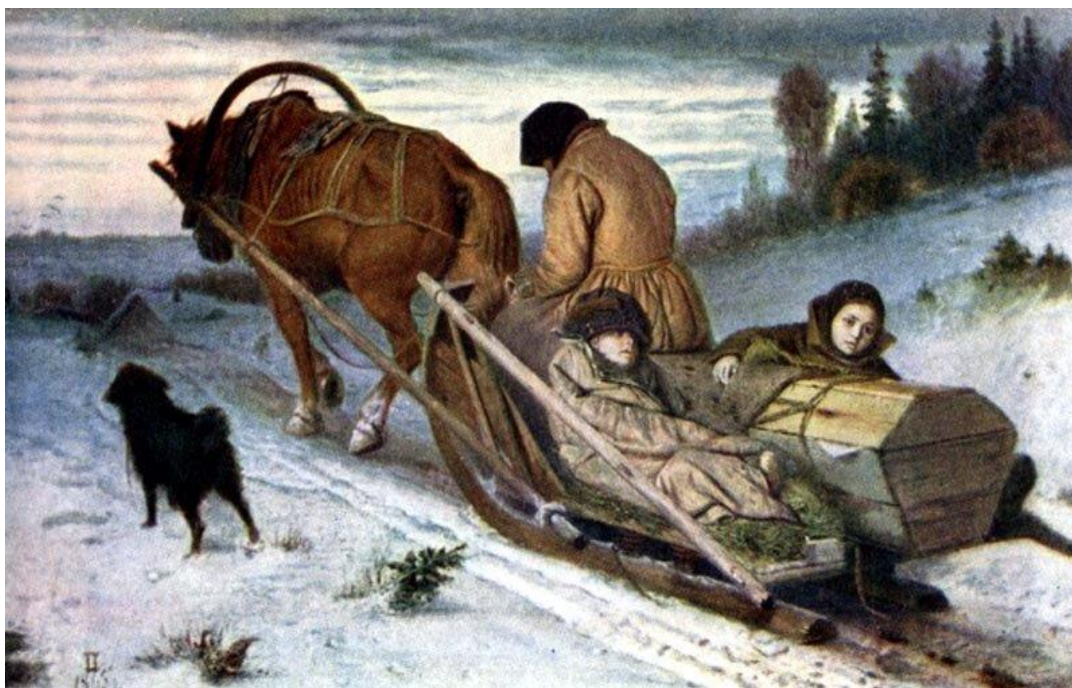
В.Перов «Проводы покойника» (1865г.)