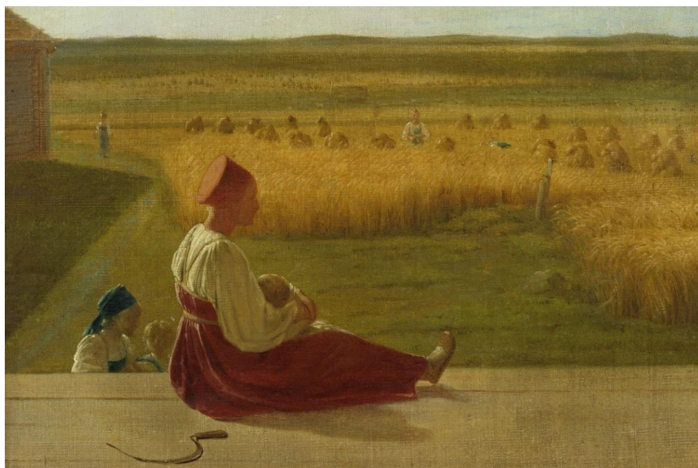
А.Венецианов «На жатве. Лето» (1820г.)