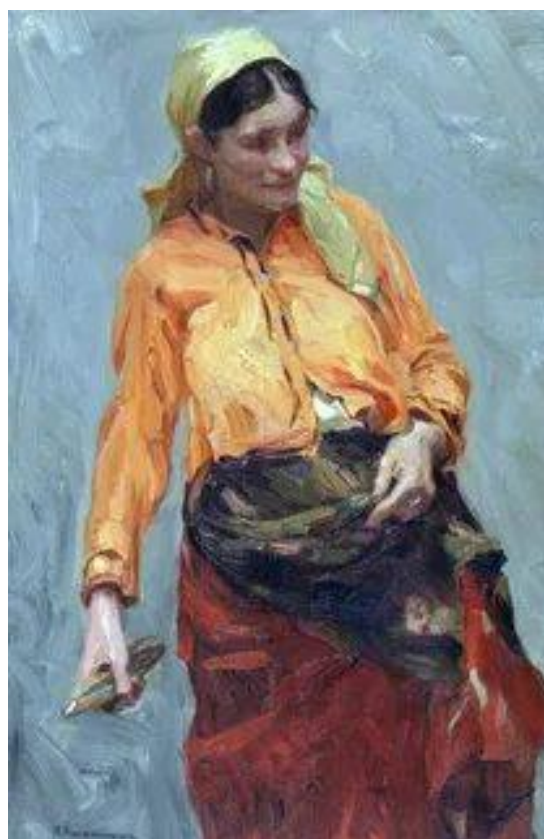
Н.Касаткин «Ткачиха», 1904