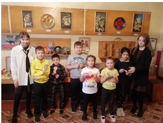
Фото 7. Общее фото с медалями