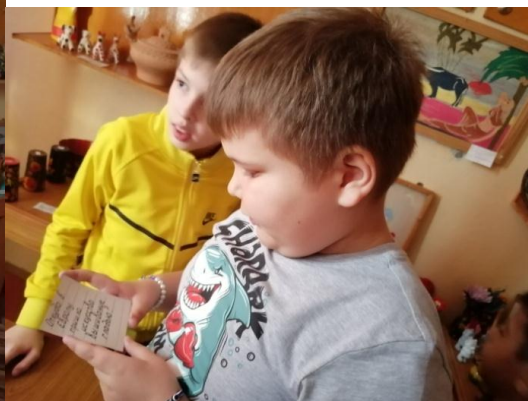
Фото 5. Игра в музее