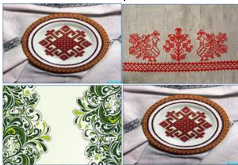
Фото 2. Фон рубашки карточек