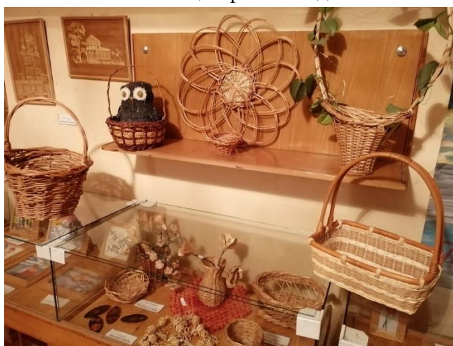
Фото.8 Экспозиция «Волшебная лоза»