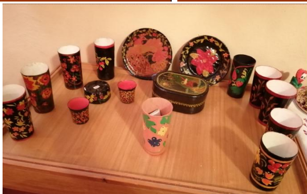
Фото 4. Пазлы