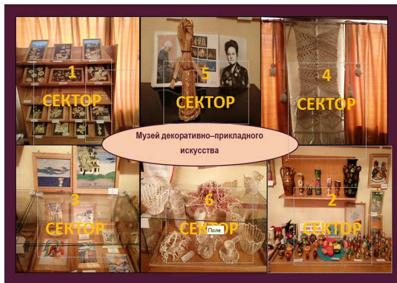
Фото 1. Игровое поле