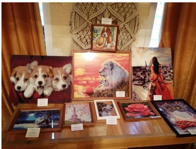
Фото 9. «Экспозиция «Волшебная мозаика»