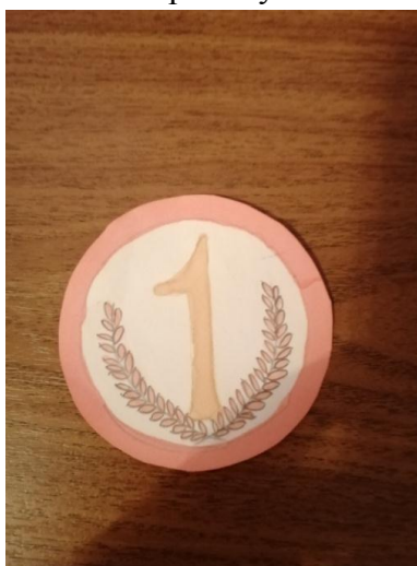
Фото 6. Медаль