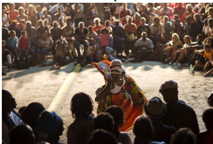
Рис. 6 Выступление танцора гво ка.