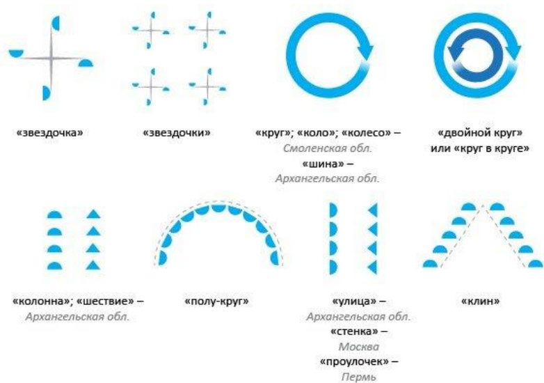
Рис. 12 Хоровод мира.