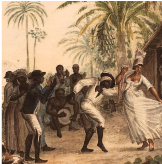
Рис.3 Внешний вид барабана ка.