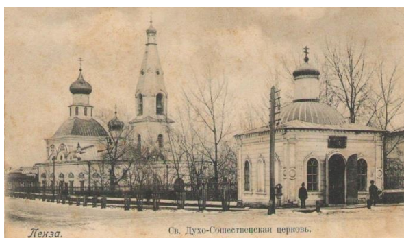
Фото № 2. Духо-сошестввенная церковь