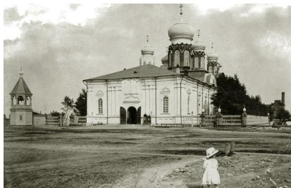
Фото № 6. Богоявленская церковь