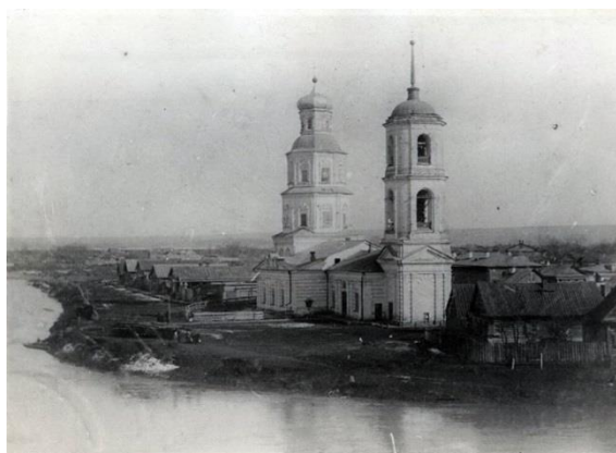
Фото № 3. Петропавловская церковь.