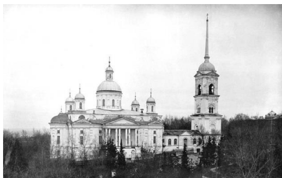
Фото № 1. Спасский Кафедральный Собор.