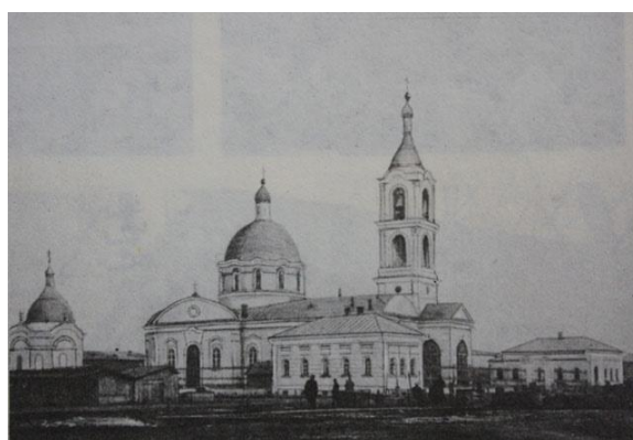
Фото № 4. Казанская церковь.