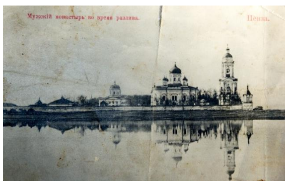
Фото № 5. Спасо-Преображенский мужской монастырь "Новый Спаситель "