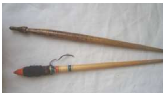
Веретено XX век с. Большая Лука Вадинский район Пензенская область

Приспособление для ручного прядения пряжи, одно из древнейших средств производства. деревянная точёная палочка, оттянутая в острие к верхнему концу и утолщённая к нижней трети. По сходству с ней, многие в целом цилиндрические структуры, заострённые с концов и слегка расширяющиеся посередине, получили название веретенovidных