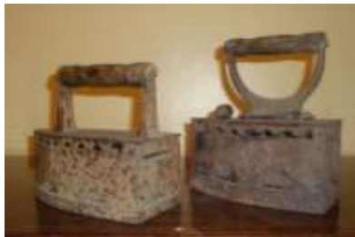
Угольный утюг конца XIX начала XX века с. Большая Лука Вадинский район Пензенская область

Деревянный, плоский, толстый, прямоугольный, вытянутый брусок с короткой округлой рукоятью. На внутренней рабочей поверхности рубеля делались поперечные рубцы. Рубель использовался для разглаживания — «прокатывания» после стирки сухой холщовой ткани. Для этого разглаживаемую ткань плотно накатывали на цилиндрические формы деревянный каток, а сверху прокатывали рабочей частью рубеля, который при этом с силой прижимали обеими руками за рукоять и противоположный конец. Лицевая поверхность рубелей обычно делалась гладкой. Но, кроме того, изготовлялось большое количество подарочных изделий, украшавшихся затейливой резьбой или росписью.