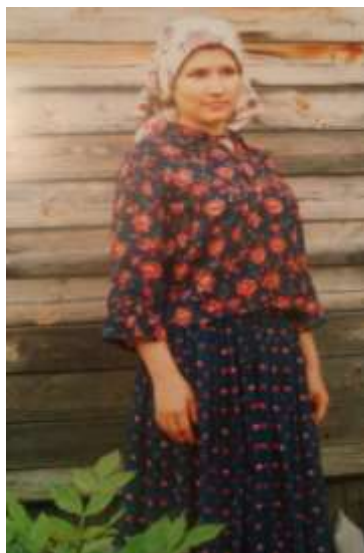
Одежда молодой женщины