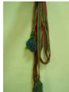
Свадебный пояс с. Тат - Лака Вадинский район Пензенской области XIX век.

Геометрический узор появляется повсеместно только на гончарных изделиях, то есть при достижении человечеством определённой степени развития мелкой моторики рук и соответствующих отделов головного мозга. Однако четкий геометрический орнамент знаком местному населению. Мужские и женские рубахи из этого района украшены только им. У рубашки расшит ворот, рукава. Всё это не просто. Узоры оберегают шею, руки. Называется этот узор оберегом.