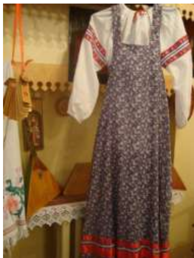
Сарафан молодой девушки