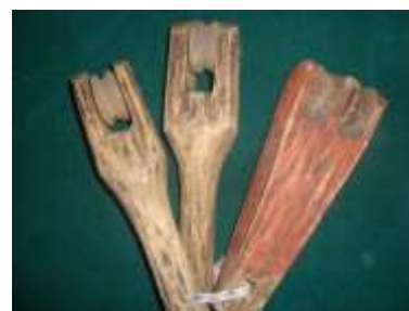
Детали от ткацкого станка

Челнок - деталь ткацкого станка, служащая для прочной нити от одного края ткани до другого. В челноке на специальном стержне укрепляется специальный полый цилиндр (шпуля) с навитой на него нитью определенной длины