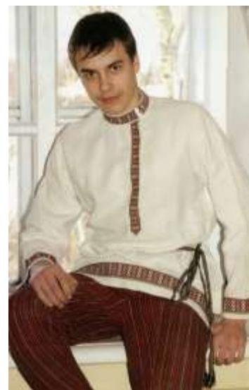
Праздничная мужская рубаха. Начало XX века, с. Коповка Керенского уезда Пензенской губ. (ныне Вадинский район Пензенской обл.).