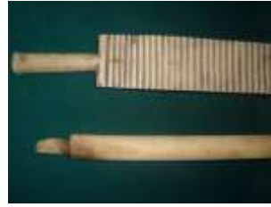
Рубель, каталка. XIX – XX век с. Большая Лука Вадинский район Пензенская область

Деревянный, плоский, толстый, прямоугольный, вытянутый брусок с короткой округлой рукоятью. На внутренней рабочей поверхности рубеля делались поперечные рубцы. Рубель использовался для разглаживания — «прокатывания» после стирки сухой холщовой ткани. Для этого разглаживаемую ткань плотно накатывали на цилиндрические формы деревянный каток, а сверху прокатывали рабочей частью рубеля, который при этом с силой прижимали обеими руками за рукоять и противоположный конец. Лицевая поверхность рубелей обычно делалась гладкой. Но, кроме того, изготовлялось большое количество подарочных изделий, украшавшихся затейливой резьбой или росписью.