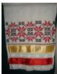
Материнский символ. XIX-XX век д. Лопатино Вадинский район Пензенская область

В свадьбе рушники используются в качестве обязательных и одних из основных символов. Одно из основных значений свадебного рушника – жизненный путь, по которому вместе должны пройти жених и невеста, муж и жена. В свадьбе используются несколько специальных рушников: на икону – родительское благословение; под хлеб, который держат родители на рушнике во время благословения молодых; два каравая; для связывания руки невесты с рукой жениха (символ соединения, неразлучности); особый рушник, который невеста приносит в дом жениха; настольные большие рушники со свадебной символикой, и т.д. В традиционной вышивке восточных славян изображение на свадебном рушнике пары птичек (жаворонков, голубков) символизирует жениха и невесту. Птички олицетворяют собой семейное счастье, верность в любви. Неслучайно на свадебном рушнике вышиваются и цветочные орнаменты. Это и оберег от злых сил, и пожелание молодым «процветания», здоровья, богатства, рождения детей. Иногда на свадебном рушнике вышиваются и первые буквы имен жениха и невесты.