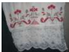
Мак. XIX-XX век с. Большая Лука Вадинский район Пензенская область

Символика винограда в вышивке раскрывает радость и красоту сотворения семьи. Сад-виноград – это жизненная нива, на которой муж – сеятель, а жена обязана растить и ухаживать за родословным деревом. Это – семейный рушник.