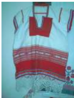
Женский праздничный передник (Запон) с геометрическим орнаментом XIX-XX век Пензенская область

Геометрический узор появляется повсеместно только на гончарных изделиях, то есть при достижении человечеством определённой степени развития мелкой моторики рук и соответствующих отделов головного мозга. Однако четкий геометрический орнамент знаком местному населению. Мужские и женские рубахи из этого района украшены только им. У рубашки расшит ворот, рукава. Всё это не просто. Узоры оберегают шею, руки. Называется этот узор оберегом.