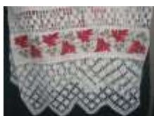
Виноград. XIX-XX век д. Свищёво Вадинский район Пензенская область

Главным символом на рушнике является символ Матери, в основе которого 8-конечная звезда. Обрамляет этот символ стилизованная гирлянда из цветов, что символизирует величие матери, ее особую роль в продолжении жизни. Наличие в рисунке желтого и голубого цветов нитей говорит об украинских корнях данной вышивки.