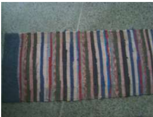
Половик домотканый XIX-XX век с. Большая Лука Вадинский район Пензенская область.

В XVIII—XIX веках утюги представляли собой металлические сооружения формы, близкой к современной. Утюги нагревались на газе или печи. В России глажение до изобретения утюга осуществлялось оригинальным способом. Белье наматывалось на скалку, после чего разглаживалось плашкой с ребрами и рукоятью. Плашка двигалась по скалке, ребра ее сглаживали замятия на ткани. Это гладильное сооружение называлось «ребрак», «раскатка», «пральник» и т. п. К середине XVIII века появился утюг с горящими углями внутри. Наиболее распространенными были нагревательные утюги, они ставились в печь и разогревались.