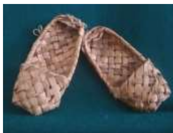
Лапти XX век с. Большая Лука Вадинский район Пензенская область (ед. ч. — лапотъ)

Лапти - один из самых древних видов обуви, низкая обувь, распространённая на Руси в старину, и бывшая в широком употреблении в сельской местности до 1930-х, Материал для лаптей всегда был под рукой: их плели из лыка липы, вяза, ракиты, вереска, из бересты и мочала. На пару лаптей обдирали три молоденьких (4-6 лет) липки. Лапотъ привязывался к ноге шнурками, скрученными из того же лыка, из которого изготавливались и сами лапти.