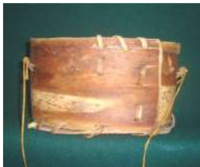
Кузовок для сбора ягод Изделия из бересты. XX век д. Лопатино Вадинский район Пензенская область

Кузовок (набирка, набируха и др.) — старинный крестьянский предмет домашнего обихода, предназначенный для сбора дикорастущих и садовых ягод. Особенно он удобен для мягких плодов, которые в кузовке абсолютно не мнутся и не выпускают ценный, питательный сок, а остаются целыми и свежими, как только что сорванные с куста, сохраняя весь свой витаминный состав длительный период времени. Это небольшая емкость объемом обычно на 2 – 2,5 литра используется, как правило, для порционного наполнения с последующим освобождением содержимого в более объемную тару. Возможно изготовление кузовков и большего объема, но практика показывает, что наполненный он тяжел и неудобен, а бечева, на которой висит, режет шею сборщика.