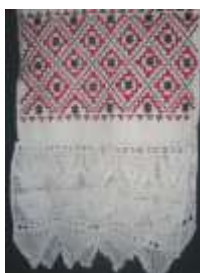
Ромб. XIX –XX век с. Большая Лука Вадинский район Пензенская область

С древних времен на Руси святили мак и им обсеивали людей и скот, потому что верили, что мак имеет волшебную силу, которая может защитить от любого зла. Также верили, что весной поле после битвы покрывается маками. Нежный и трепетный цветок несет в себе незабвенную память рода. Девушки, в семье которых был погибший, с любовью и тоской вышивали узоры мака на сорочках, а на головы надевали веночки из семи маков, обещая этим ритуалом сберечь и продолжить свой род.