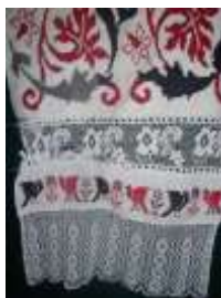
Рушник свадебный. XIX-XX век с. Большая Лука Вадинский район Пензенская область.

В свадьбе рушники используются в качестве обязательных и одних из основных символов. Одно из основных значений свадебного рушника – жизненный путь, по которому вместе должны пройти жених и невеста, муж и жена. В свадьбе используются несколько специальных рушников: на икону – родительское благословение; под хлеб, который держат родители на рушнике во время благословения молодых; два каравая; для связывания руки невесты с рукой жениха (символ соединения, неразлучности); особый рушник, который невеста приносит в дом жениха; настольные большие рушники со свадебной символикой, и т.д. В традиционной вышивке восточных славян изображение на свадебном рушнике пары птичек (жаворонков, голубков) символизирует жениха и невесту. Птички олицетворяют собой семейное счастье, верность в любви. Неслучайно на свадебном рушнике вышиваются и цветочные орнаменты. Это и оберег от злых сил, и пожелание молодым «процветания», здоровья, богатства, рождения детей. Иногда на свадебном рушнике вышиваются и первые буквы имен жениха и невесты.