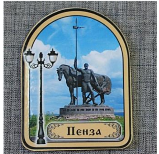
Monument To The First Settler

This monument is dedicated to the first residents of our city. This is the most recognizable symbol of the city. It can be found on souvenirs, sweets. Most residents of our city consider the monument a business card of the city, but they can't pronounce its name clearly. The sculpture, as you can see, consists of a male first settler and a horse. The man represents the first settler, the warrior-defender, and the serf. At the foot of the monument is an inscription: 1663-city to build. Behind the monument is an observation deck on Sura and the surrounding areas. This place is a kind of beginning of our route.