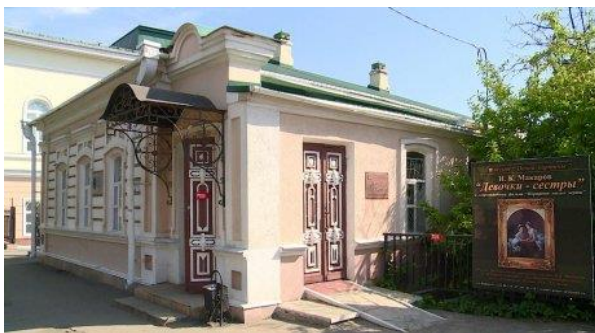
Museum of one painting

copy of the defensive rampart of those times. In our time, this place is part of the walking area that leads from the Spassky Cathedral to the Monastery.