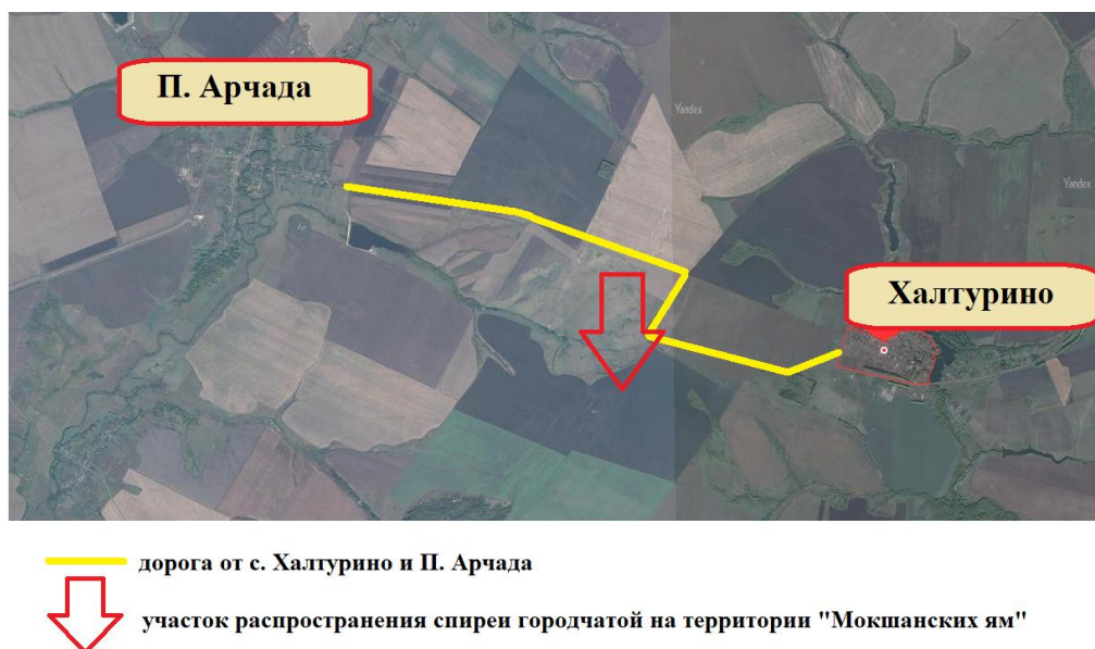
Рис. 2 Карта распространения спиреи городчатой на границе Кольшлейского и Каменского районов Пензенской области (составлена автором)

Результатом описания участка стало создание «Карты распространения спиреи городчатой на границе Кольшлейского и Каменского районов Пензенской области», отдельно нами был нанесен описываемый участок на карту распространения спиреи городчатой по территории Пензенской области Красной книги ПО (см. рис.3).